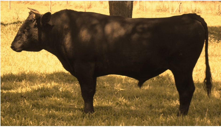
AGZ Michifuku 06