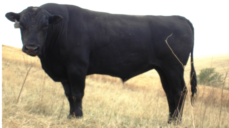
Bar R Sanjirou 42K