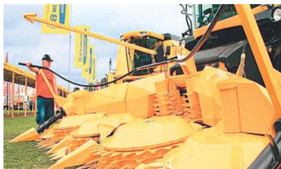
Produtores rurais de várias regiões do país foram conferir as novidades tecnológicas para o campo

Show Rural Coopavel recebeu público recorde na edição deste ano em Cascavel (PR)