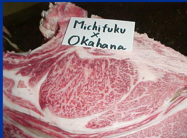
Corte de costela de um animal puro Wagyu